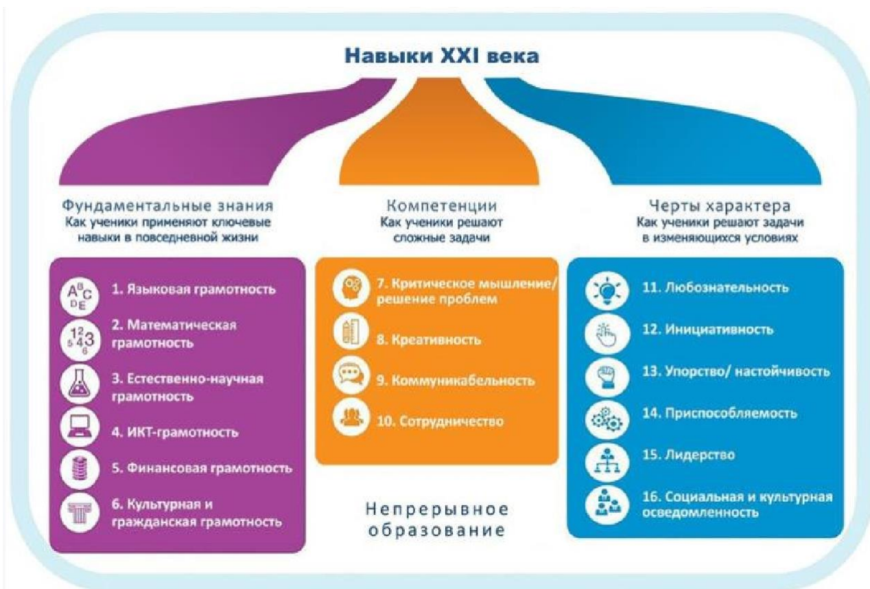
Рисунок 1. Образовательная модель World Economic Forum

С целью решения этой проблемы проектной группой Всемирного экономического форума была разработана и представлена в докладе «Новый взгляд на образование» модель, включающая в себя три типа образовательного результата: знания предметных областей с акцентом на функциональные грамотности, включая ИКТ-грамотность, компетенции 4К и качества характера.