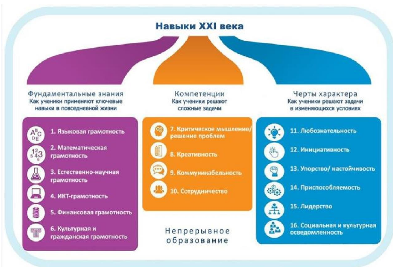
Рисунок 1. Образовательная модель World Economic Forum

С целью решения этой проблемы проектной группой Всемирного экономического форума была разработана и представлена в докладе «Новый взгляд на образование» модель, включающая в себя три типа образовательного результата: знания предметных областей с акцентом на функциональные грамотности, включая ИКТ-грамотность, компетенции 4К и качества характера.