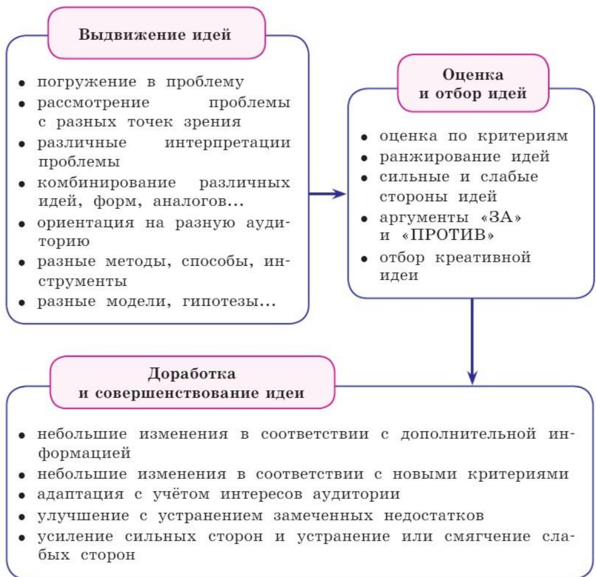
Рисунок 2. Действия, требуемые при выполнении заданий на креативность

При оценивании заданий учитывается, что креативная идея (решение) – это всегда идея: